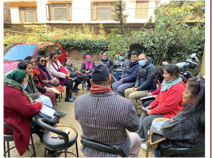
युवा तथा साना व्यवसायी स्वरोजगार कोषका पदाधिकारीसँगको छलफलमा अपाङ्गता अधिकारकर्मी

युवा तथा साना व्यवसायी स्वरोजगार कोषले युवा स्वरोजगार कार्यक्रमसँग सम्झौता गरी बेरोजगार युवाहरूलाई ऋण उपलब्ध गराउने सहकारीमा कम्तीमा २ सय शेयर सदस्य हुनुपर्ने र सहकारी दर्ता भएको २ वर्ष हुनुपर्ने व्यवस्था छ । छलफलका क्रममा उहाँले अपाङ्गता भएका व्यक्तिद्वारा स्थापित सहकारीमा २५ जना शेयर सदस्य भइ ३ महिना पुरा भएमात्रै पनि ऋण प्रवाह गर्न योग्य हुने र कोषले उनीहरूसँग काम गर्ने प्रतिवद्धता उहाँले जनाउनुभयो । उहाँले अपाङ्गता भएका व्यक्ति र महिलाहरूलाई स्वरोजगार बनाउन आफुले सक्दो सहयोग गर्ने र यसका लागि यहाँहरूका माग अनुसार सकारात्मक विभेदमार्फत स्वरोजगारमा उनीहरूलाई सहभागी गराउने बताउनुभयो ।