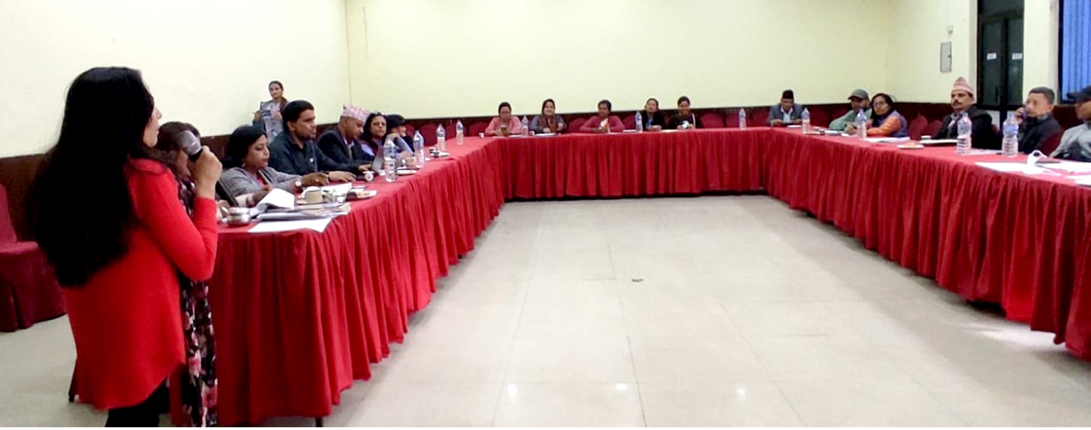
काठमाडौं महानगरपालिकाका वडा अध्यक्ष र कार्यपालिका सदस्यहरूसँग अन्तर्क्रिया

अन्तर्क्रियामा उपस्थित वडा अध्यक्षहरूले यी सवालहरूलाई आफ्ना योजनामा समावेश गर्ने प्रतिवद्धता जनाएका थिए । कार्यक्रममा काठमाडौं महानगरपालिकाका र बुढानीलकण्ठ नगरपालिकाका वडा अध्यक्षहरू सदस्य बुढानीलकण्ठ नगरपालिकास्थिति