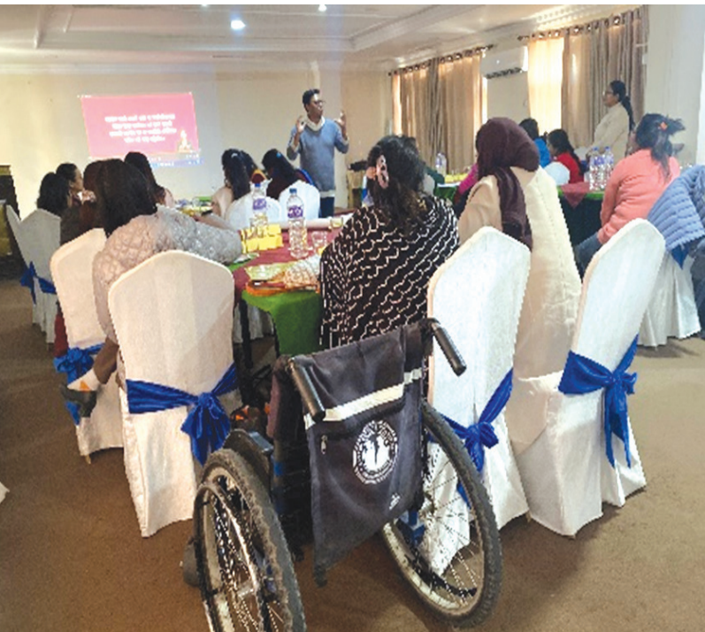
केस व्यवस्थापन तालिममा सहभागीहरू

नेपाल अपाङ्ग महिला संघले काठमाडौंमा आयोजना गरेको तीन दिने केस व्यवस्थापन तालिम सकिएको छ । कर्मचारी, पालिकास्थित न्यायिक समितिमा कार्यरत सरकारी कर्मचारीहरू र नेपाल अपाङ्ग महिला संघको कार्यकारी समितिका पदाधिकारी र सदस्यहरूका लागि यो तालिम सञ्चालन गरिएको हो ।