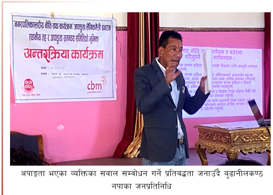
अपाङ्गता भएका व्यक्तिका सवाल सम्बोधन गर्ने प्रतिवद्धता जनाउँदै बुढानीलकण्ठ नपाका जनप्रतिनिधि

नेपाल अपाङ्ग महिला संघले काठमाडौँ महानगरपालिका र बुढानीलकण्ठ नगपालिकाका वडा अध्यक्ष र कार्यपालिका सदस्यहरूसँग अन्तर्क्रिया गरेको छ । अपाङ्गता भएका महिलाका सवाल पालिकाको नीति तथा कार्यक्रम र बजेटमा सम्बोधन होस भन्ने उद्देश्यले संघले वडा अध्यक्ष र अपाङ्गता भएका महिलाहरूको सञ्जालसँग अपाङ्गता समन्वय समितिसँग अन्तर्क्रिया कार्यक्रमको आयोजना गरेको हो । अन्तर्क्रियाका क्रममा संघले आगामी आर्थिक वर्षमा अपाङ्गता