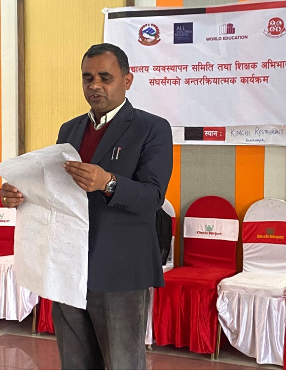
विद्यालयको वार्षिक योजना प्रस्तुत गर्दै प्रधानाध्यापक

नेपाल अपाङ्ग महिला संघले उच्च र न्युन प्रविधिका सिकाइ सामग्री र तालिम उपलब्ध गराएका विद्यालयका प्रधानाध्यापक, विद्यालय व्यवस्थापन समितिका अध्यक्षहरू, शिक्षक अभिभावक संघका अध्यक्ष र वडाका प्रतिनिधिसँग अन्तर्क्रिया कार्यक्रम सम्पन्न गरेको छ। संघले काठमाडौं, ललितपुर, धादिङ र काभ्रेमा गरी पाँचवटा छलफल कार्यक्रम गरेको हो। सिकाइको विश्वव्यापी ढाँचाका सिद्धान्तमा आधारित रहेर उच्च र न्युन प्रविधि प्रयोग गरी बालबालिकाको सिकाइमा विविधता र आवश्यकता