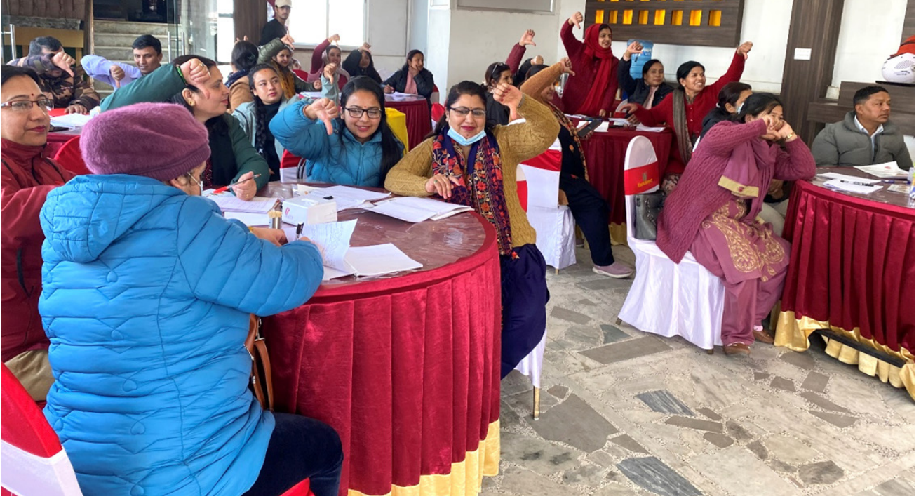
पुनर्ताजगी तालिममा सहभागी

शिक्षकहरूलाई यिनै सिद्धान्तमा रहेर प्रारम्भिक तहका अन्यसँगै सिकाइमा संघर्ष गरिरहेका वा कठिनाइ भएका बालबालिकालाई कक्षाकोठामा न्युन र उच्चप्रविधि प्रयोग गरी समान सिकाइ कसरी हासिल गर्ने भन्ने बारेमा तालिममा सिकाइएको थियो। सिकाइको विश्वव्यापी सिद्धान्तको महत्त्व, कक्षा कोठा व्यवस्थापन र वैयक्तिक शैक्षणिक योजनाका बारेमा स्वयं शिक्षकहरूको सहभागितामा समूहकार्य मार्फत तालिम सहजीकरण गरिएको थियो। समूहकार्य र अन्तर्क्रियात्मक विधिले सिकाइको विश्वव्यापी सिद्धान्तका बारेमा बुझाइ अझ स्पष्ट भएको सहभागीहरूले प्रतिक्रिया दिएका थिए।