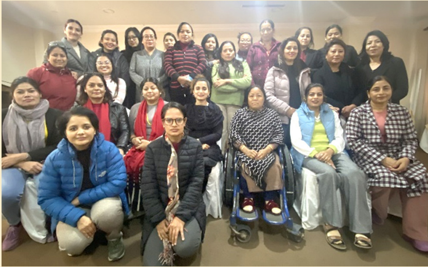
नेपाल अपाङ्ग महिला संघका पदाधिकारी र कर्मचारी

नेपाल अपाङ्ग महिला संघको यो वर्ष गरिएको कामका बारेमा समीक्षा गर्न यही माघ १८ र १९ गते गरी दुई दिने समीक्षा तथा योजना तर्जुमा छलफल सम्पन्न भयो। छलफलमा कार्यसमितिका पदाधिकारी, सदस्यहरू र कर्मचारीहरू सहभागी थिए। बैठकको पहिलो दिन नेपाल अपाङ्ग महिला संघका आन्तरिक नीति र पाँच वर्षे रणनीतिका बारेमा कर्मचारी र कार्यसमितिका सदस्यहरूलाई अभिमुखीकरण गरिएको थियो।