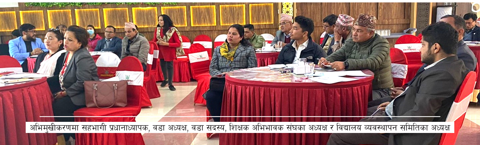
अभिमुखीकरणमा सहभागी प्रधानाध्यापक, वडा अध्यक्ष, वडा सदस्य, शिक्षक अभिभावक संघका अध्यक्ष र विद्यालय व्यवस्थापन समितिका अध्यक्ष

अभिमुखीकरणका क्रममा छलफल गरिएको थियो। अभिमुखीकरणमा सहभागीहरूले प्रविधिमाफत गरिने सिकाइ उत्कृष्ट हुने कुरामा सहमति जनाएका थिए। अभिमुखीकरणमा सबै विद्यालयका प्रधानाध्यापकहरूले विद्यालयको आगामी वार्षिक योजनामा उच्च तथा न्युन प्रविधिलाई पाठ्यक्रममा समावेश गरी शिक्षण सिकाइ गर्ने र यी सामग्रीहरू व्यवस्थापन गर्ने प्रतिवद्धतासहित योजना तयार गरेका थिए।